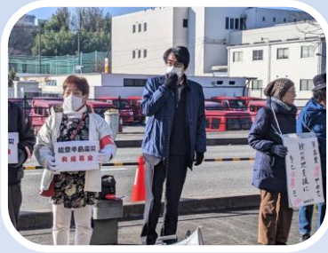
能登半島地震 救援募金の訴え