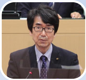
本会議で一般質問