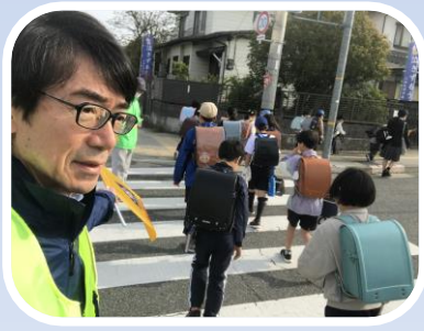
通学時の「子ども見守り隊」活動